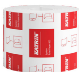
156007 Katrin System Toilettenpapier 800 Blatt 2-lagig