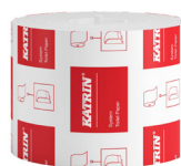
103424 Katrin System Toilettenpapier 800 Blatt 2-lagig