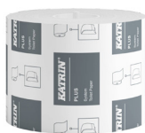
66940 Katrin Plus System Toilettenpapier 800 Blatt 2-lagig