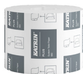
156052 Katrin System Toilettenpapier 680 Blatt 2-lagig