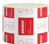
156104 Katrin System Toilettenpapier 567 Blatt 2-lagig, Gelb

Beispielhafte Auswahl aus allen Ländern. Die Verfügbarkeit für einzelne Regionen finden Sie auf der Webseite.