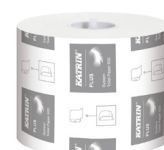
968 Katrin Plus System Toilettenpapier 500 Blatt 3-lagig