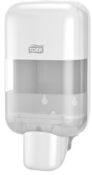
Tork Mini Spender Seife_Desinfekt. 565200