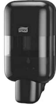
Tork Mini Spender Seife_Desinfekt. 565208